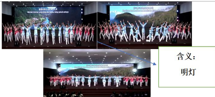
图 11 《永伴幸福》幸福是世界的明灯，信心开心陪我走遍每个角落