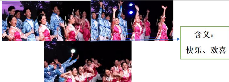
图7《永伴幸福》一辈子充满快乐，欢喜