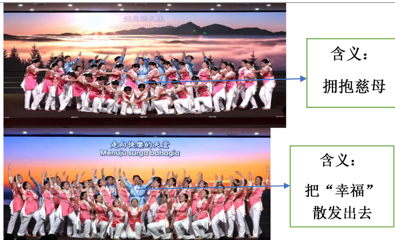
图 10 《永伴幸福》满足的人生，走向快乐的天堂