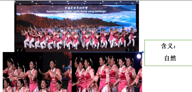
图8《永伴幸福》幸福是世界的珍宝，心灵自然