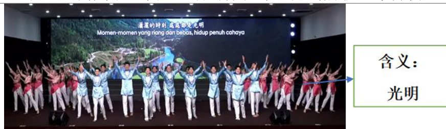
图 12 《永伴幸福》潇洒的时刻，处处都是光明