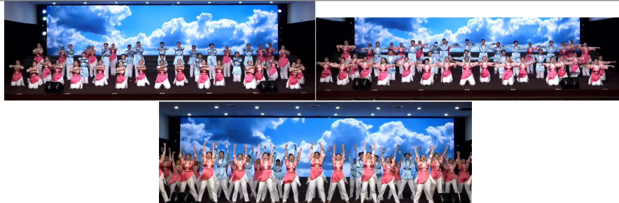
图5《永伴幸福》浪花青年团，一起努力，一起奋斗，世界一家，一起加油