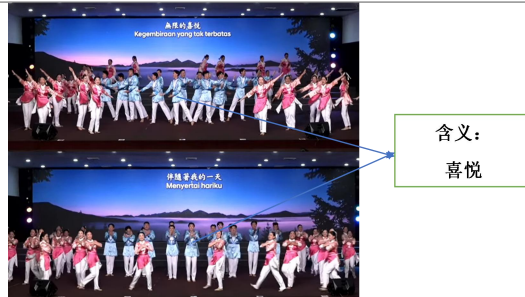
图6《永伴幸福》无线的喜悦，伴随着我的一天

3. 知行合一的价值升华：“至真至善至美”主题在作品中重复呈现两次：首次以清晰规整的手势完成概念的认知性传递，第二次则以更为舒展从容的肢体语言实现境界的内化表达，清晰展现了从“认知价值”到“践行价值”的体悟进阶（王雪，2024；张艳琳，2018）。