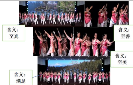
图9《永伴幸福》至真至善至美，满足的人生